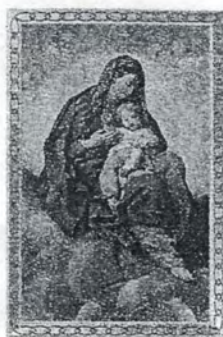
La Virgen con el Niño en la Gloria. Carlo Maratti. Museo Nacional del Prado. Madrid.

También en noviembre: “Encuentro de cristianos en la vida pública”.