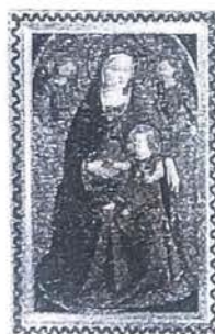
La Virgen de la granada. Fra Angelico. Museo Nacional del Prado