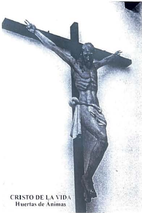
CRISTO DE LA VIDA Huertas de Ánimas

Sacaremos algunas sillas. Los que quieran que lleven asientos en sus coches para seguir más cómodamente la misa. Hora: 7'30 de la tarde.